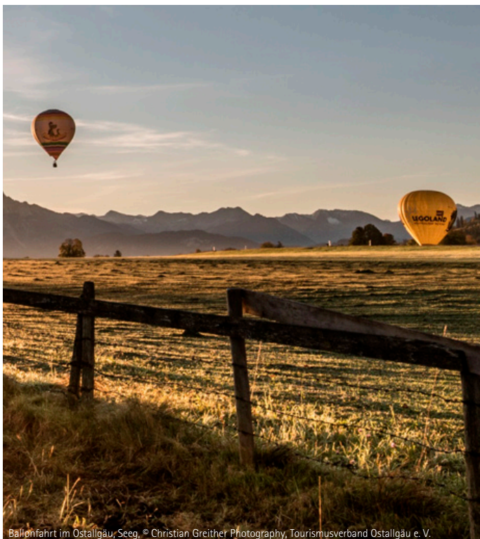
Ballonfahrt im Ostallgäu, Seeg