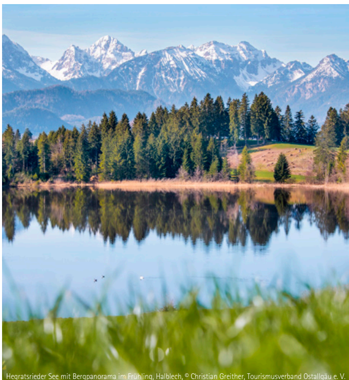
Hegratsrieder See mit Bergpanorama im Frühling, Halblech