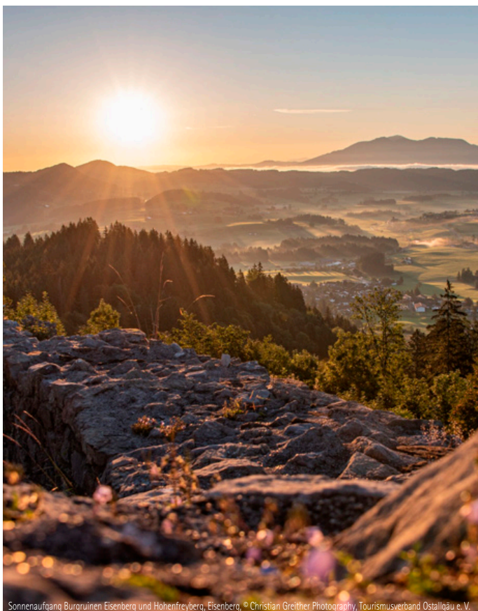
Sonnenaufgang Burgruinen Eisenberg und Hohenfreyberg, Eisenberg, © Christian Greither Photography, Tourismusverband Ostallgäu e. V.